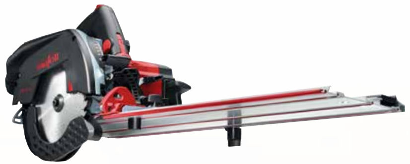
Kappschiene-Säge KSS 50 18M bl